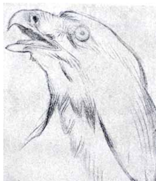
Mánesovy studie k praporu

navrhl architekt Josef Fanta, jeden z nejvýznamnějších představitelů secesní architektury u nás. Obě části praporu byly posléze umístěny v Scheinerově síni v sokolovně Sokola Pražského.