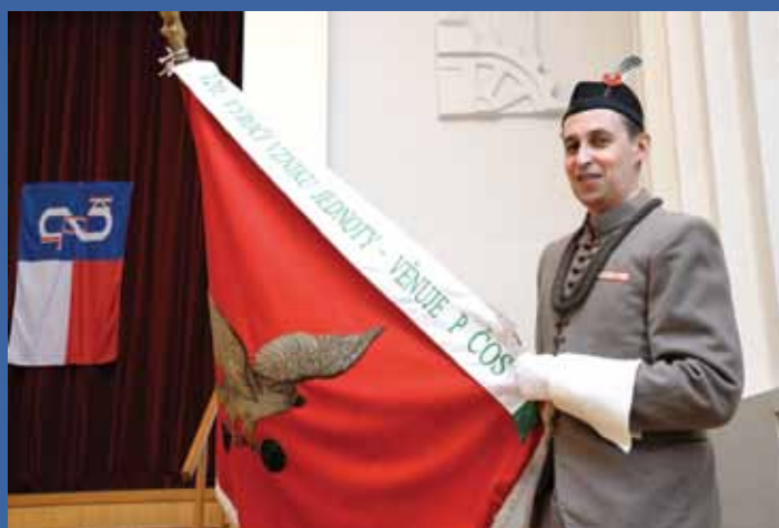
Slavnostní zavěšení stuhu v T.J. Sokol Židlochovice 11. prosince 2016 ke 120. výročí založení. Prapor je uložen na jednotě.