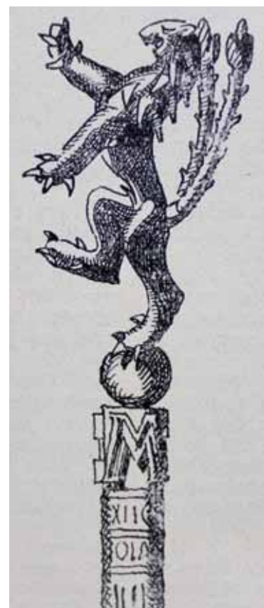
Náčrt hlavičky čestného praporu T. G. Masaryka