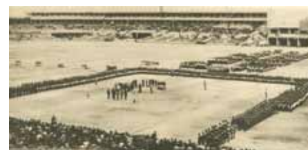
Celkový pohled na slavnostní odevzdání praporu