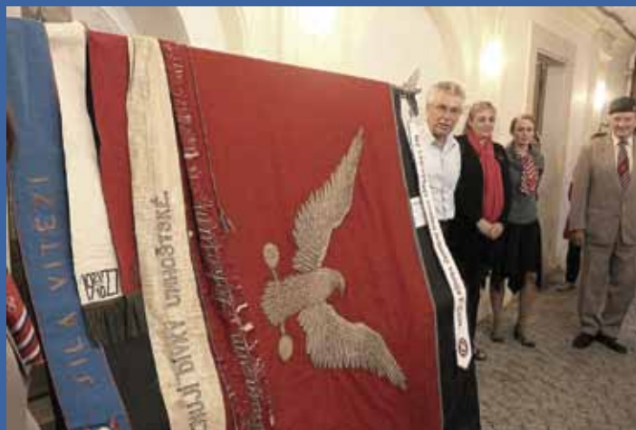
Slavnostní zavěšení stuhu 21. září 2017 v Unhošti ke 130. výročí založení jednoty. Prapor je uložen v unhošťském muzeu.