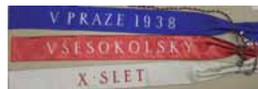
Stuha Benešova praporu