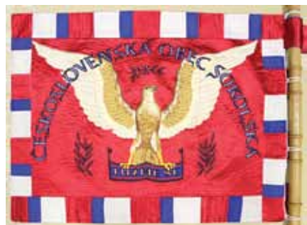
Licová a rubová strana praporu věnovaného T. G. Masarykem