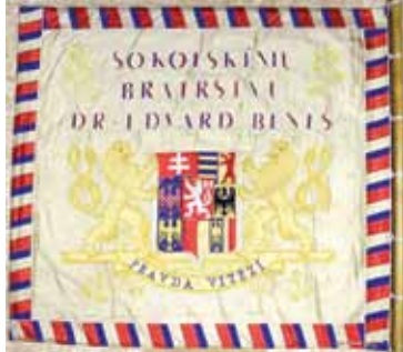
Licová a rubová strana praporu věnovaného Edvardem Benešem

i všem, kteří přijdou po nás, pobídkou, aby veškeré naše jednání řídilo se vždy zásadami sokolskými. A jsem jist, že nebude žádné poskrvny nikdy, která by praporu tomu byla pohanou.“ T. G. Masaryk odpověděl: „Děkuji ti, bratře, za tvá slova. Naši mně řekli, že je to nejpěknější prapor, který máme v Praze. Nevím, zdali je to pravda, ale ve vašich rukou bude jistě praporem nejkrásnějším!“ Ze Španělského sálu se hosté přemístili na první nádvoří Pražského hradu, kde již byla připravena sokolská čestná rota. Zde, za přihlížení obecenstva a za zvuku státních hymen, byl čestný prapor slavnostně uveden.