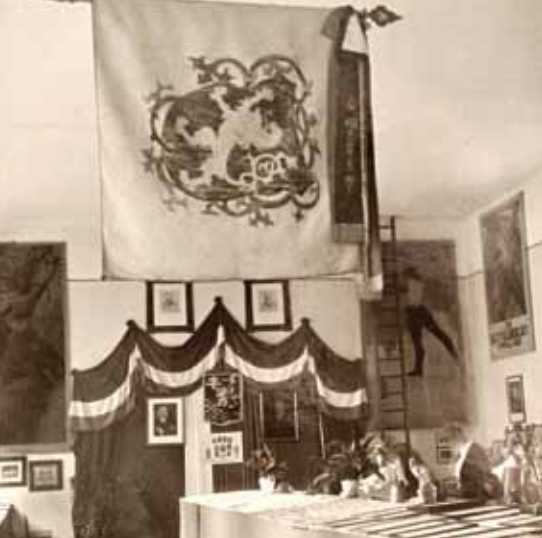
Oslavy 50 let jednoty v roce 1937

Zbraslavský Sokol se dlouho pyšnil unikátem – neobvyklým praporem s náboženskou tematikou, dokonce jej za platný sokolský prapor muselo schválit předsednictvo ČOS. Autorství bylo původně celé připisováno Josefu Mánesovi, pozdější výzkumy přisoudily spoluautorství také některému z jeho žáků.