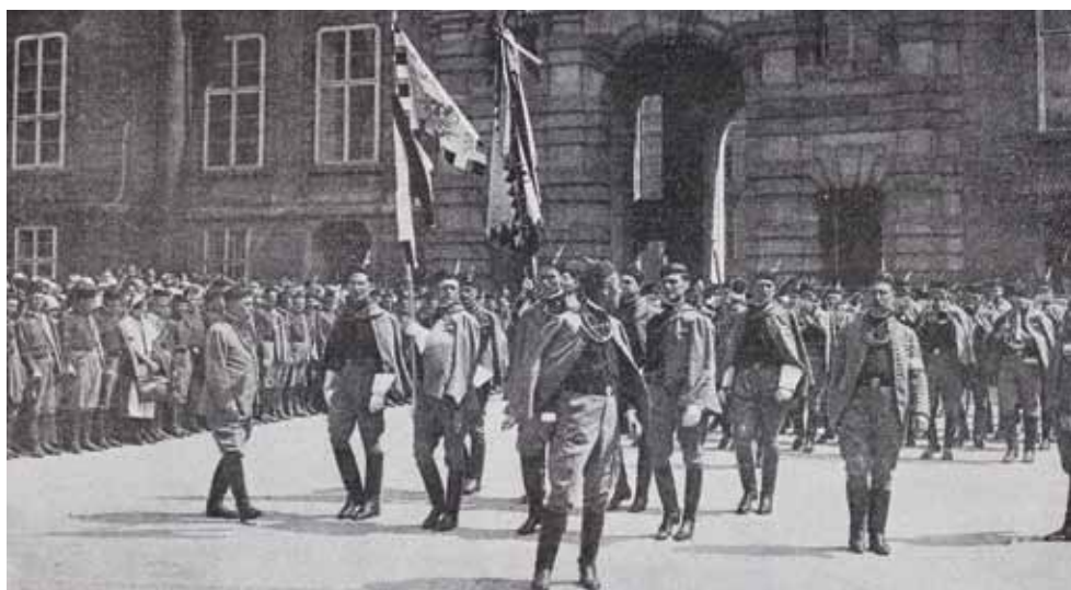
Čestná četa odnáší právě věnovaný prapor T. G. Masaryka