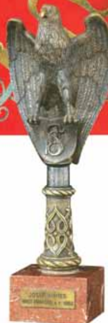
Nahoře kopie Mánesova praporu z roku 1887, dole zadní část originálu a hlavice