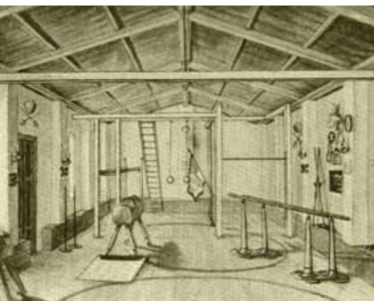
Vnitřek příbramské tělocvičny

Sokol v Příbrami byl založen v srpnu roku 1862, povolení k zřízení spolku ale bylo obdrženo až o rok později. Hned po založení začali členové několikrát týdně se cvičením. V létě využívali letní tělocvičnu na dvoře tehdejší měšťanské školy na náměstí a v zimě cvičili v sále Měšťanské besedy. Ve svých počátcích kromě pravidelného navštěvování tělocvičen organizovali výlety po přírodních a kulturních památkách v širokém okolí.