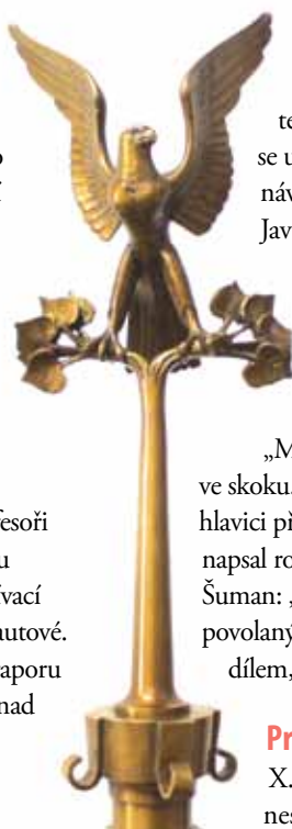
Hlavice Benešova praporu