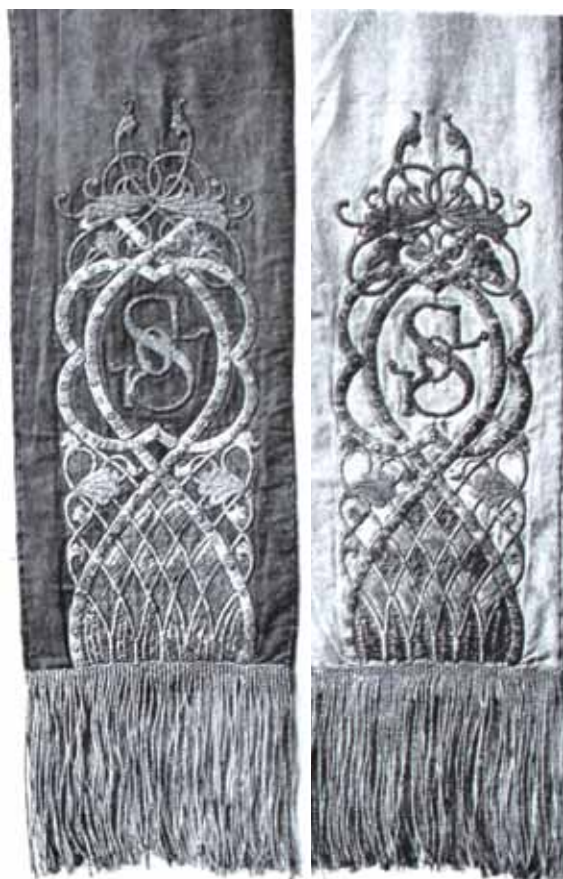
Stuhy k praporu