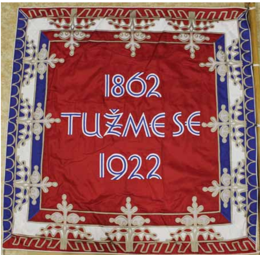
Líc a rub praporu věnovaného ženským odborem Sokolu Pražskému