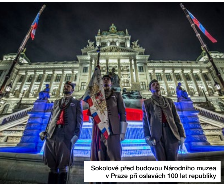
Sokolové před budovou Národního muzea v Praze při oslavách 100 let republiky

Po celé odpoledne byla otevřena budova sokolovny, kam se mohli návštěvníci nejen přijít ohřát v chladném sobotním počasí, ale také mohli zhlédnout výstavu fotografií o historii Sokola, výstavu