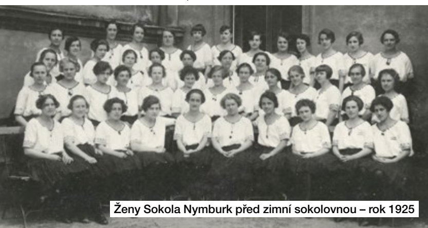
Ženy Sokola Nymburk před zimní sokolovnou – rok 1925