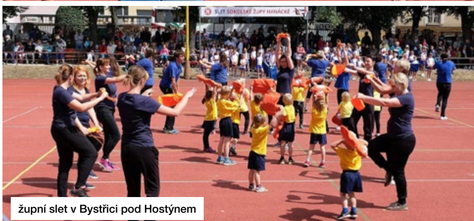
župní slet v Bystřici pod Hostýnem