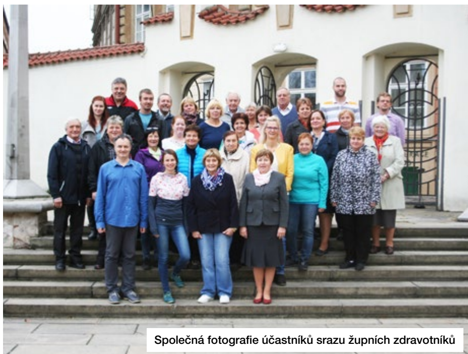
Společná fotografie účastníků srazu župních zdravotníků