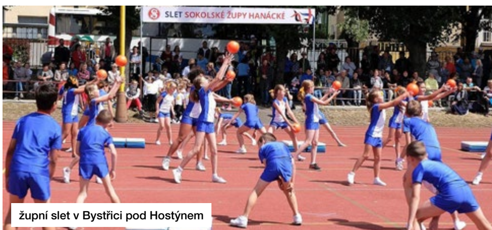
župní slet v Bystřici pod Hostýnem