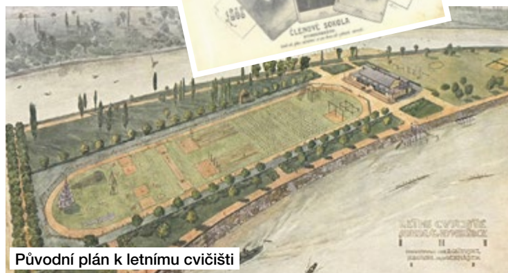
Původní plán k letnímu cvičišti

Před 150 lety, 1. října 1868, i v Nymburku započalo sokolské hnutí svou práci s jasnými cíli podílet se na celospolečenském rozvoji, demokracii, posílení vlastenectví a všeobecném rozvoji ducha i těla každého člověka. O oslavách tohoto výročí v Nymburku jsme informovali v minulém vydání. Nyní stručně připomínáme historii této sokolské jednoty.