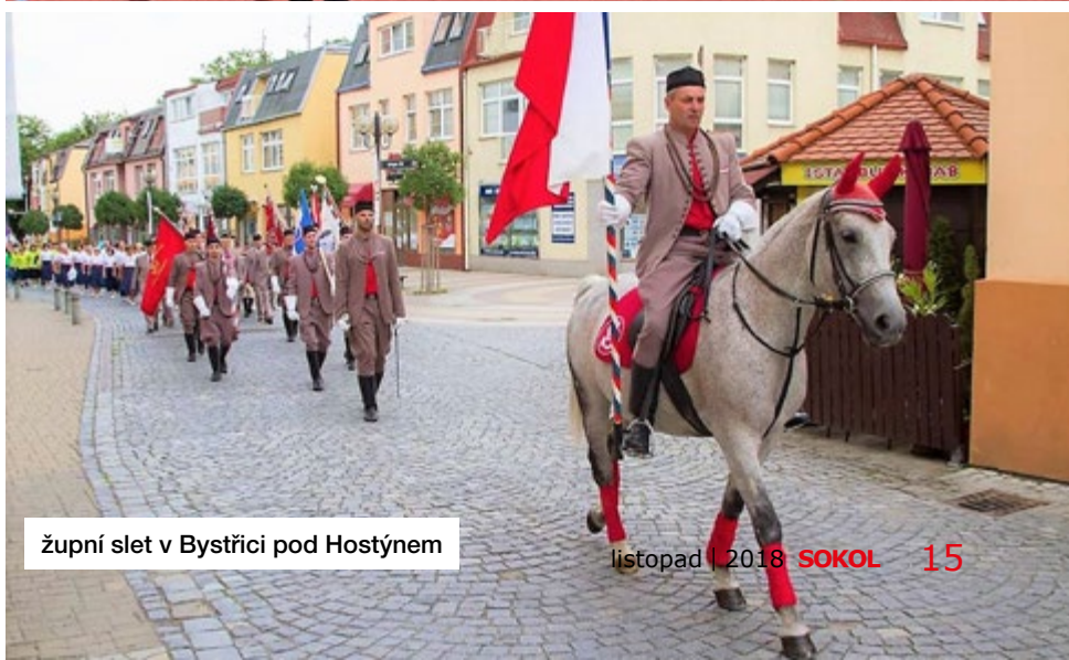
župní slet v Bystřici pod Hostýnem